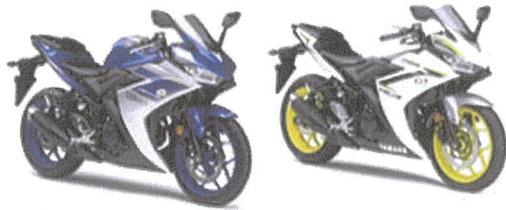
新250cc ロードスポーツ ヤマハ