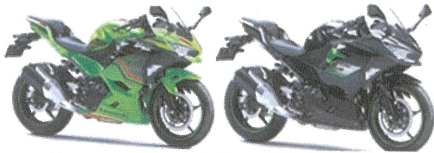
Kawasaki Ninja 250