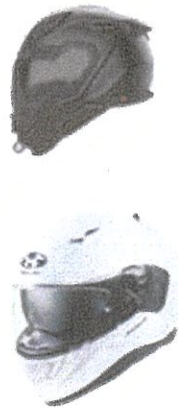
OGK カブト フルフェイス ヘルメット