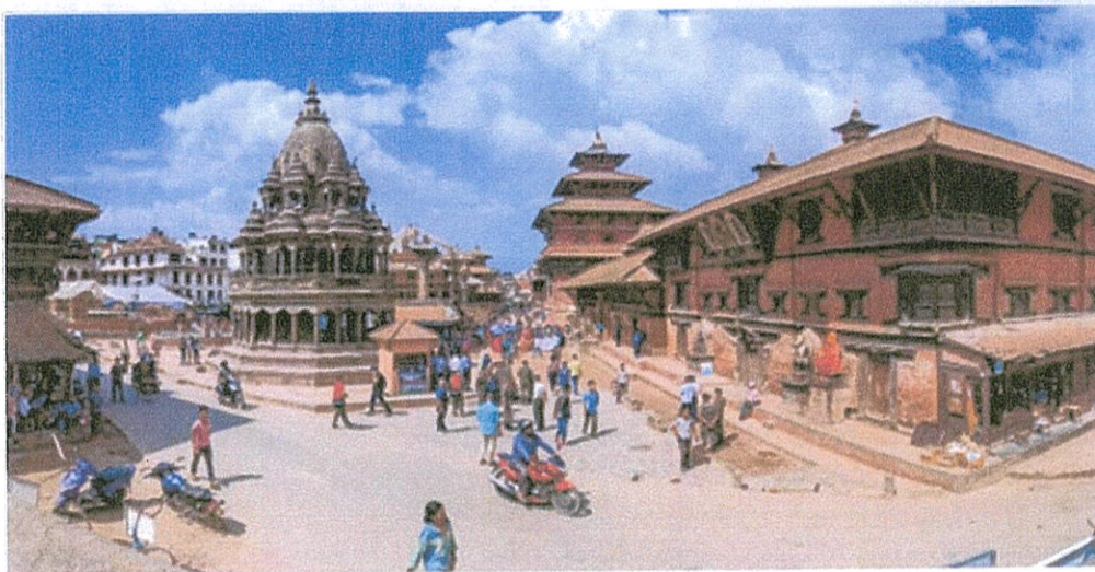
ラリトブルの パタン・ダルバール広場